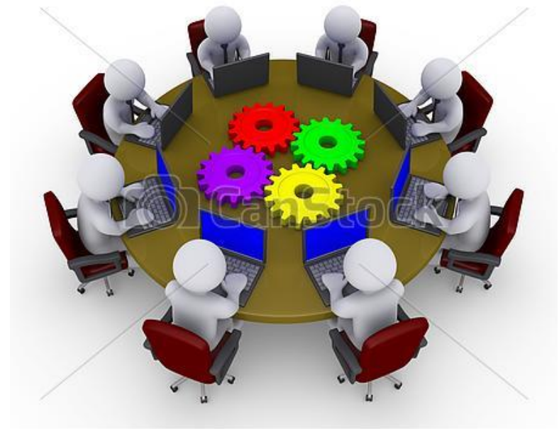
© Can Stock Photo - csp9255212